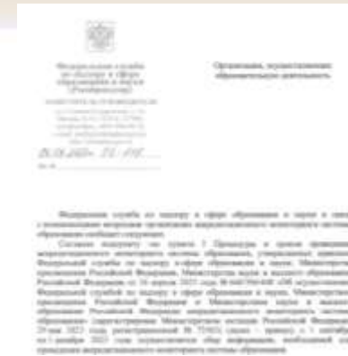
Письмо Рособрнадзора от 06.09.2023 №03-148