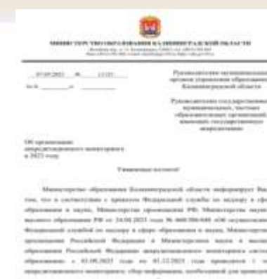
Письма МО КО от 07.09.2023 №11125, от 23.09.2023 №11301, от 13.09.2023 №11414